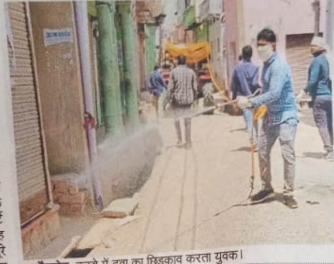
बड़ौदामेव. कस्बे में दवा का छिड़काव करता युवक।